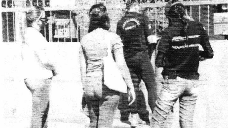
As visitas técnicas aos moradores serão realizadas nos próximos 10 dias

Por maior transparência, evento será realizado no dia 8 de novembro, às 14 horas, no Parque de Exposições