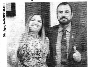
Com emenda parlamentar paga, município deve adquirir ambulância

A emenda parlamentar do deputado estadual Issam Saado no valor de R$120.000,00 mil paga nesta quinta-feira (21) ao município de Buriti do Tocantins irá custear a aquisição de uma ambulância para o município.