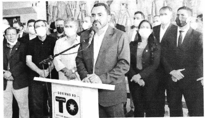
Governador Wanderlei Barbosa destacou que dará continuidade a todos os projetos em andamento

As melhorias fazem parte do Projeto de Saneamento Integrado Águas de Araguaína, que contempla uma série de obras nos bairros, a criação de bacias de retenção da água das chuvas, e a implantação de vários pontos de área verde, totalizando um investimento de mais de R$ 350 milhões, recurso obtido junto ao CAF - Banco de Desenvolvimento da América Latina. (Ascom/Araguaína)